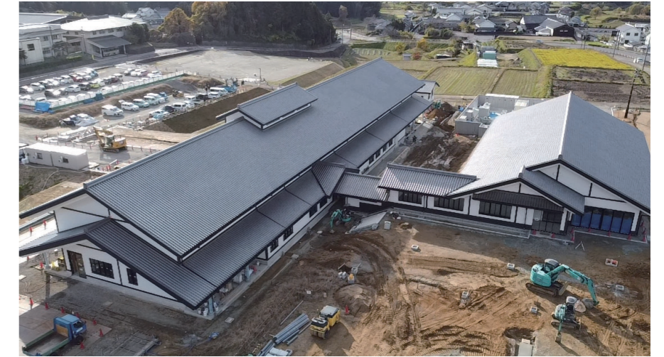
敷地北東上空から