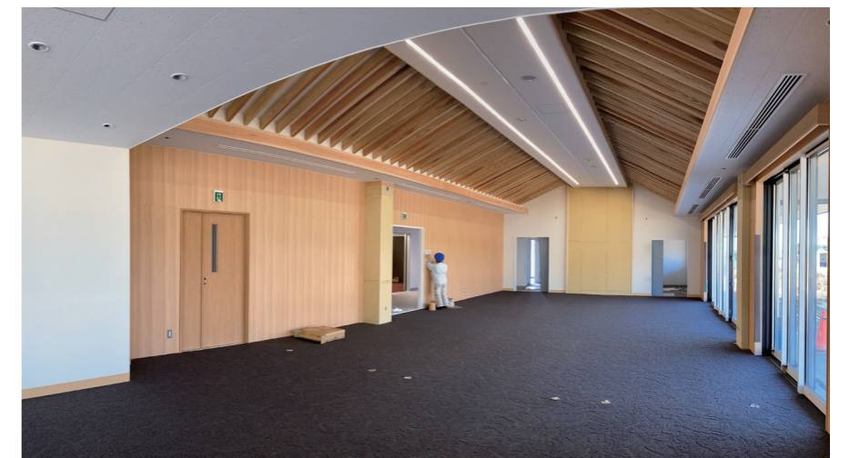
交流棟 | 交流室