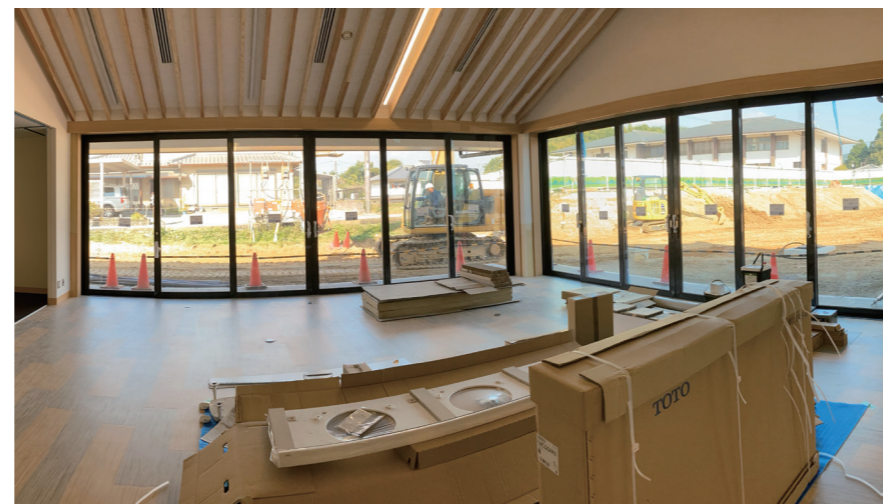
交流棟 | 交流ホール