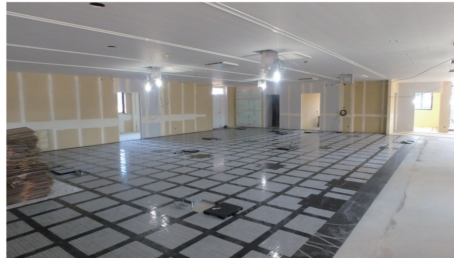
行政棟 | 執務室